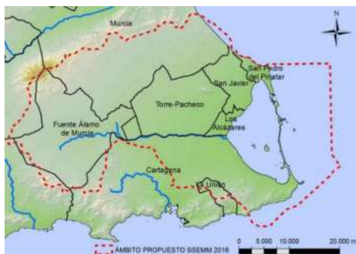
Ilustración 1. Ámbito del Sistema Socioecológico del Mar Menor cubierto por la ITI