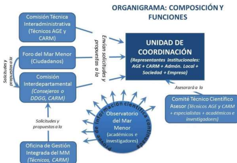
Ilustración 3. Órganos previstos en la EGISSEMM

Por su parte la Estrategia de Gestión Integrada, dirigida a mejorar la cooperación y coordinación de todos los agentes del Sistema Socioecológico del Entorno del Mar Menor, también prevé una estructura de gobernanza: