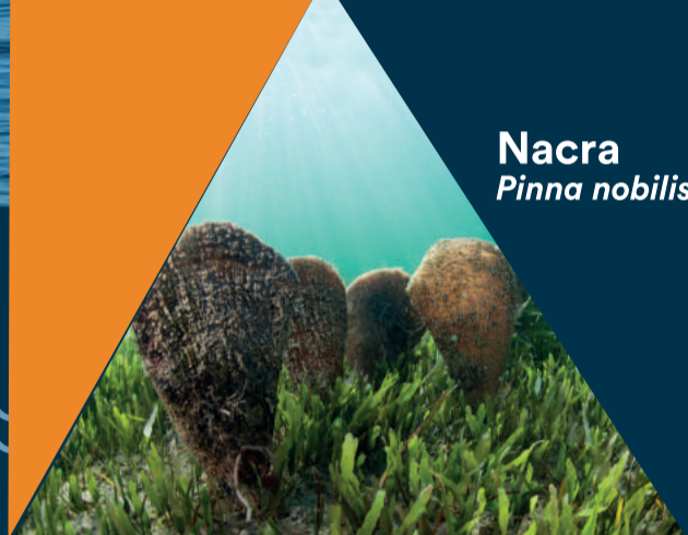
Nacra Pinna nobilis